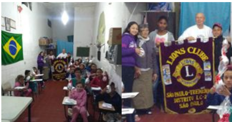
Entrega de ovos de páscoa para as crianças do projeto Cidadania apoiado pelo nosso Lions