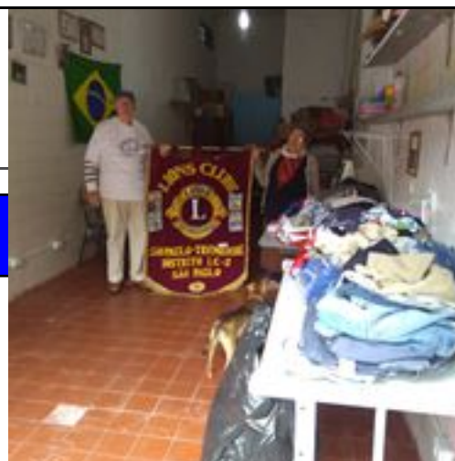
Entrega de roupas para a comunidade do Jardim das pedras e crianças do Projeto Cidadania ao Alcance de todos apoiado por nosso Lions